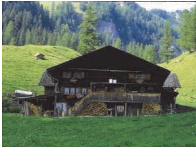
Chälihütte Der Unterstafel zu Langermatten vor dem Oberlaubhorn