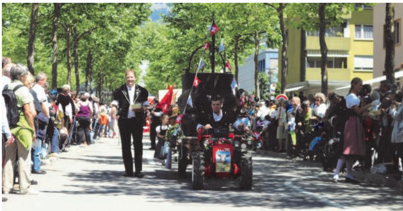
Die CasAlp Crew in voller Aktion