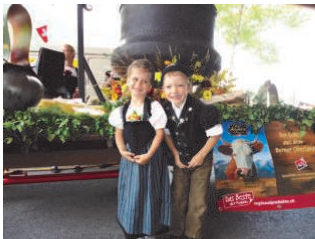
Die „heimlichen“ Stars des Festes

Am Sonntag säumten rund 70'000 Besucher die Strassen von Interlaken. Das Schweizer Fernsehen berichtete live vom Fest-Umzug. Der Umzugswagen von CasAlp und Schweizer Alpkäse, ein alter Aebi Zweiachsmäher, zog ein schönes Käsekessi durch das Publikum. Holz und schöne Blumen stellten das Feuer unter dem Kessi dar. Unter den begeisterten Zuschauern wurde Berner Hobelkäse AOC verteilt. Der Rummel war gross. Alle wollten eine Rolle des „chüschtigen“ Käses ergattern. Ein Mann mit Räf sowie zwei entzückende Kinder rundeten das Bild ab und ernteten von allen Seiten herzlichen Applaus. Das Wetterglück, die unterschiedlichsten Fuhrwerke und die fröhlichen Besucher machten das Fest perfekt.