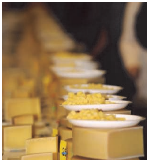
Unser Berner Hobelkäse AOC steht zum Degustieren bereit

Nach Eingang der Anmeldung schicken wir Ihnen eine Rechnung mit Einzahlungsschein.