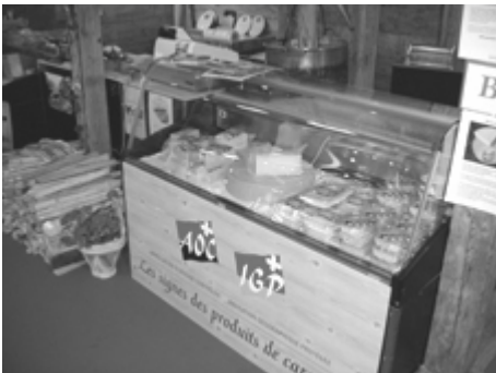
Auftritte des Berner Alp- und Hobelkäses an der BEA

An der diesjährigen Bea in Bern wurden unser Berner Alp- und Hobelkäse AOC wiederum am Stand der Schweizerischen Vereinigung zur Förderung von AOC und IGP mit anderen AOC Produkten präsentiert. Auch am Stand des Schweizer Alpkäses war der Berner Alpkäse prominent vertreten. Und schliesslich konnte man den Berner Alpkäse beim Auftritt der Lobag mit Regionalprodukten ‚Das Beste der Region‘ degustieren und kaufen.